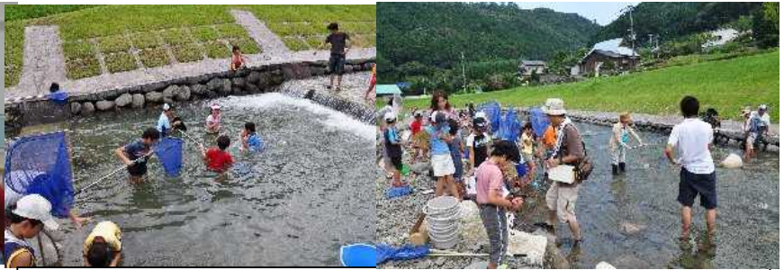
8/16 高良川の上流にある一ノ瀬親水公園で魚取りをしました。タカハヤとカワヨシノボリが獲れました。